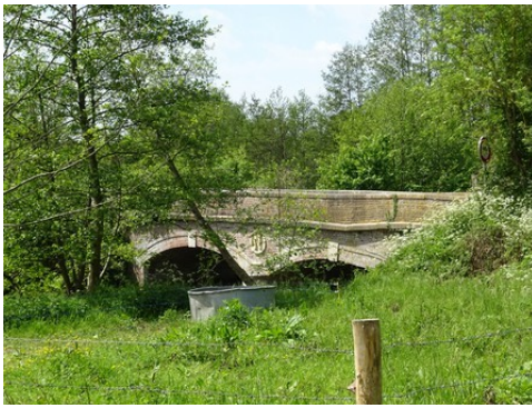
Le Pont Napoléon (vue éloignée)