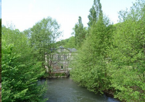
Les vues sur la vallée de la Risle