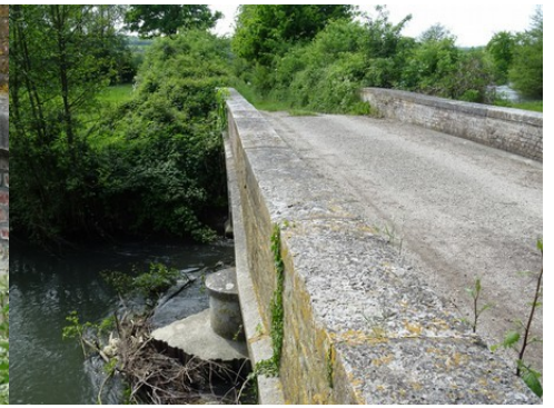
La pile centrale à bec et le parapet