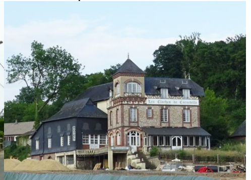
L'auberge des Cloches de Corneville