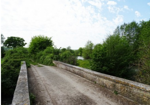
La chaussée et l'environnement du pont