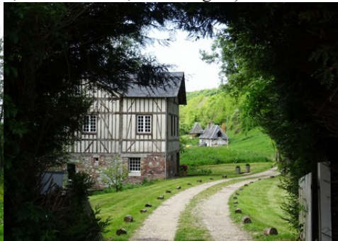
Le bâti voisins, à pans de bois