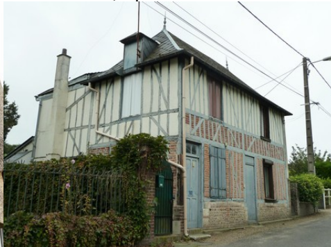
Un autre exemple de maison ancienne