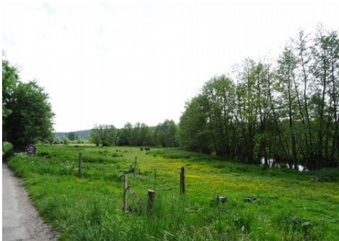
La vallée de la Risle (vue générale)

Les avis seront cohérents avec ceux émis ces dernières années, à savoir : pas de maisons à volume compliqué (type V, W, Y, ou Z), pentes à 45° pour les volumes principaux, ardoise ou tuile plate de teinte brun vieilli, à 20u/m 2 , avec un débord de toiture de 20cm, enduit de teinte beige clair avec modénatures (au choix : chaînages, encadrement de fenêtres, soubassement, colombage...). *Voir les autres fiches.