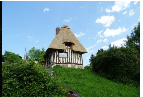
L'association pans de bois / toit en chaume