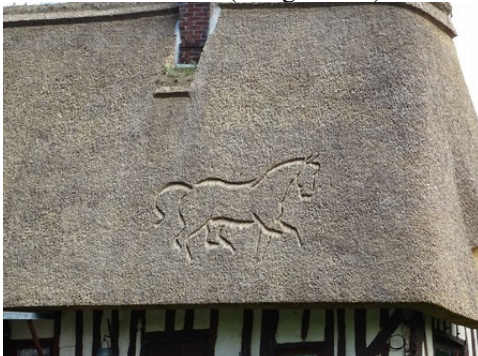
La personnalisation du toit en chaume