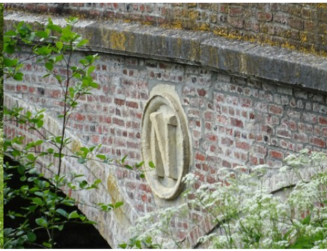
Le N de Napoléon III en médaillon